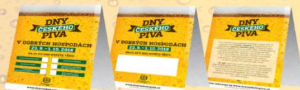
POS MATERIÁLY (FORMÁT STŘECHY)